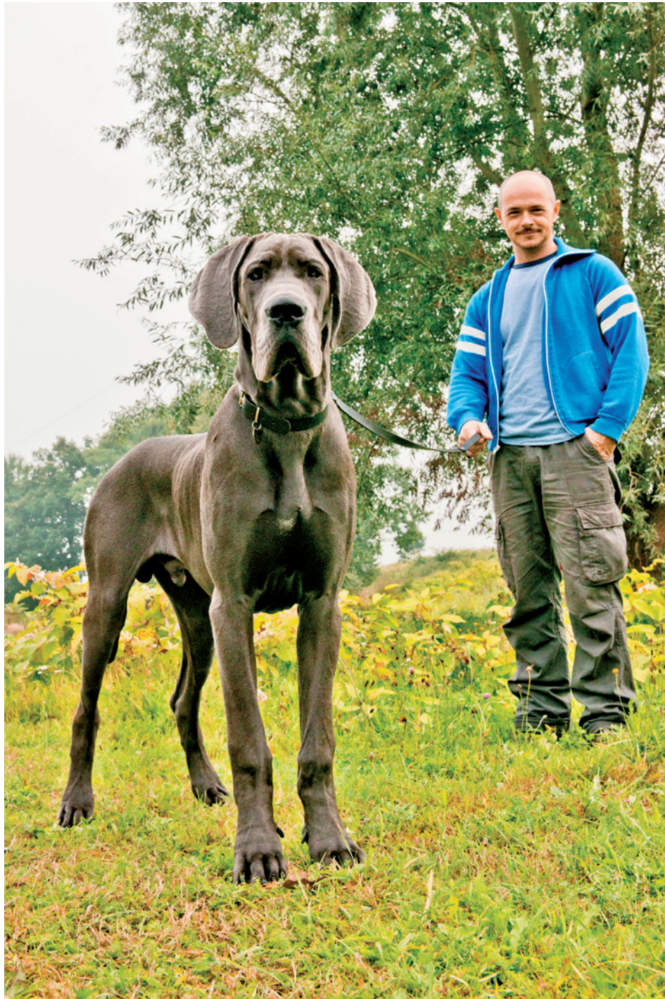
Voor Gemeente Apeldoorn, campagne 'Heel Apeldoorn rein'