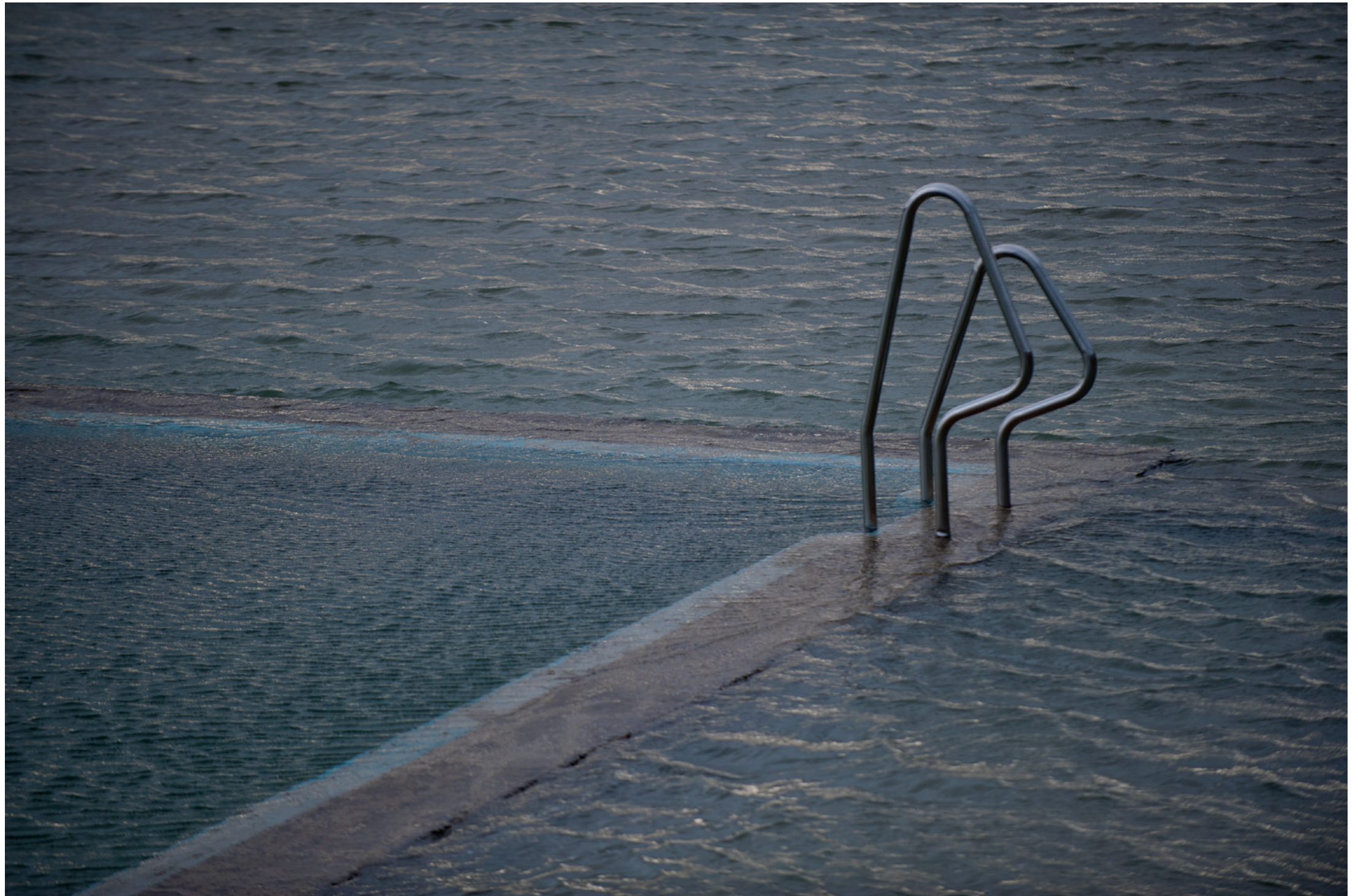
Vrij werk, Binic, Frankrijk