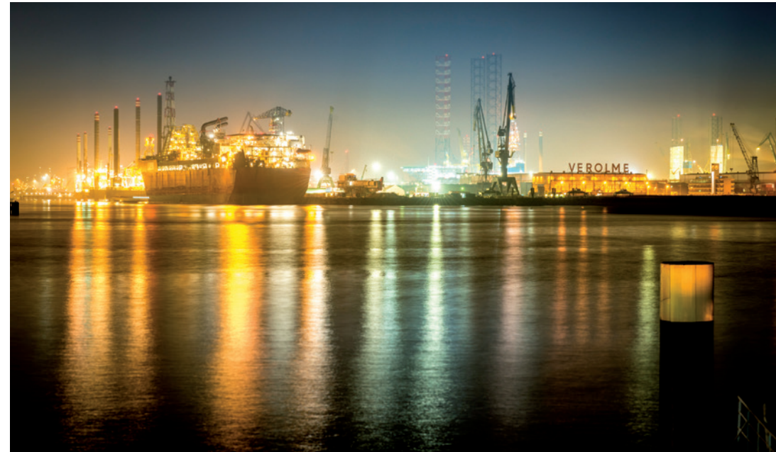
Voor corporate brochure/jaarverslag Tauw, Deventer

» 4 Als ik de Staatsloterij win, wil ik een fotoboek maken van mensen langs de poolcirkel. Die intrigeren mij enorm. Zij leven een half jaar in het licht en een half jaar in het donker. Het zijn prettige mensen, ondanks dat ze heel geïsoleerd wonen. Je zou het tegenovergestelde verwachten. Het licht is daar anders. De schemerperiode, die bijna een halve dag duurt, heeft heel mooi licht.