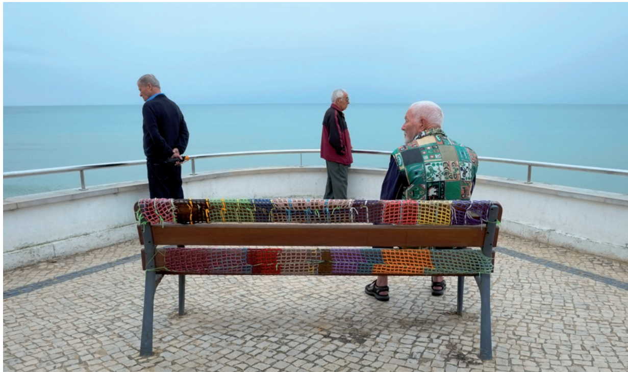
Vrij werk, Armação de Pêra, Portugal

» 1 Fotografie is voor mij grotendeels een ambacht. Ik vind het leuk om vrij werk te maken maar ik ben geen kunstenaar, voel die drang ook niet. Ik ben ook geen perfectionist. Maar ik wil het wel heel goed doen.