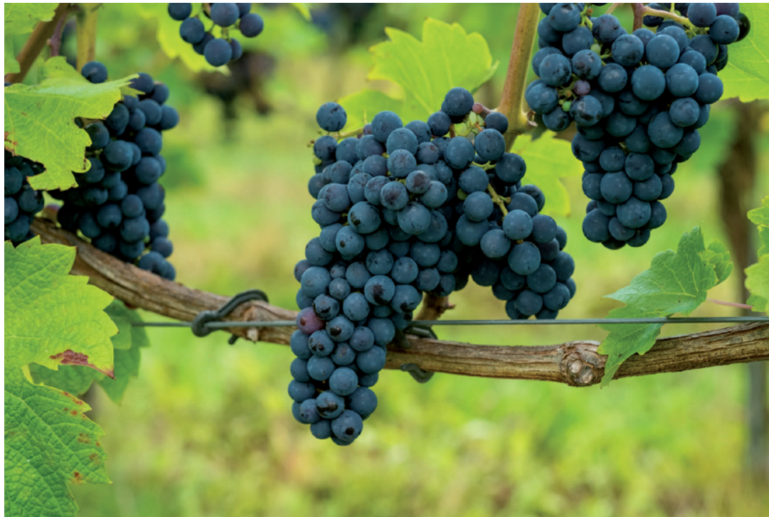
Foto voor het boek 'Wijn van eigen bodem', Uitgeverij Forte Culinaire